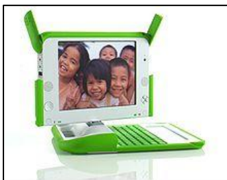
One Laptop per Child : un portable par enfant

L'accès aisé de tout un chacun aux Tic laisse entière la question de leur utilisation pédagogique. Comment, dans ma pratique pédagogique au quotidien, intégrer les Tic et « faire des Tice » ?