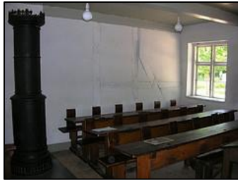
Ma première salle de classe en 1970 ressemblait à cette image

Pour remettre en cause sa pratique professionnelle, il est important que celle-ci soit stabilisée. L'acte d'enseigner ne peut pas être réinventé chaque jour. Tout enseignant utilise des routines pour pouvoir travailler au quotidien. Le mot routine est employé positivement : « Connaissance, habileté acquise par l'expérience, la pratique plus que par l'enseignement ou l'étude. » 3