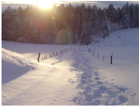
Le crêt Moniot

> Cliquer pour entendre un commentaire audio :